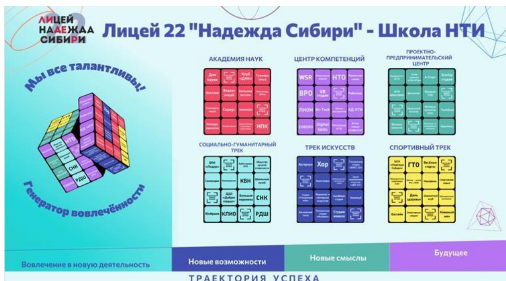
Рисунок 1. Генератор вовлеченности

Механизмом вовлечения детей в образовательные процессы стал Генератор вовлеченности учащихся (рисунок 1). Он наглядно демонстрирует, какие условия созданы для индивидуализации процесса обучения в лицее.